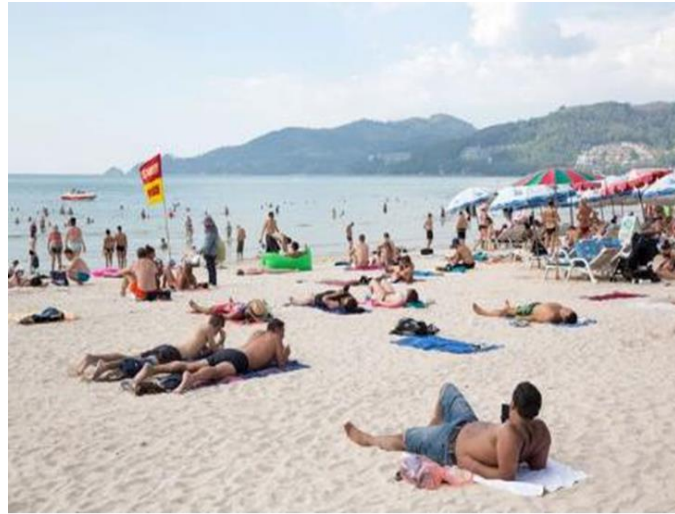
2018年のブーケット