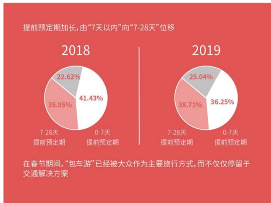
表2 2019年春節休暇カーレンタル旅行予約リードタイム 2018年2019年比較